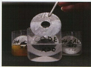
他社製品 ほとんど変わらず