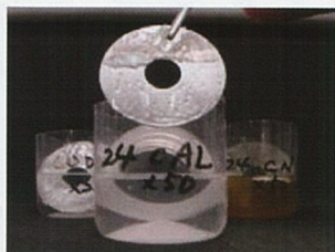
ヴァニクレン24CAL 約90%落ちている