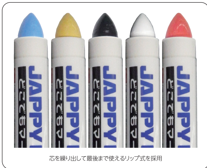
芯を繰り出して最後まで使えるリップ式を採用