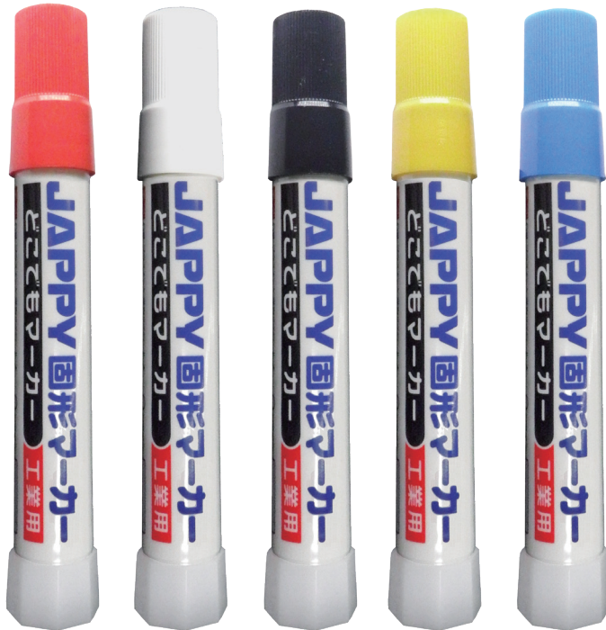
▲赤 ▲白 ▲黒 ▲黄 ▲青