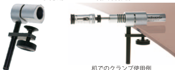
机でのクランプ使用例